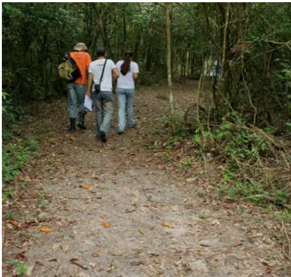
Fig. 5 – Trecho da trilha Barreiro do Anta.