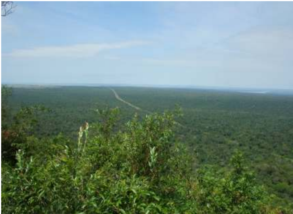
Fig. 3 –Vista do alto do Morro do Diabo, destaque para rodovia SP 613 que corta o Parque.

A trilha do Morro do Diabo é o cartão de visita do Parque, essa dá acesso a uma vista panorâmica da Unidade de Conservação. Além da beleza cênica, a função atribuída desse local para a Educação Ambiental é a importância dos corredores de fluxo, sendo possível mostrar outros extratos vegetativos no entorno dessa Unidade que estão sendo interligados. O principal objetivo desses corredores de fluxo é possibilitar o tráfego de animais e o cruzamento da linhagem genética. Outro papel designado é também mostrar a ameaça causada pelo assentamento de reforma agrária na área do parque, os canaviais, a linha férrea e a rodovia SP-613. Veja a (Fig. 3) a qual mostra a rodovia SP-613 e a (Fig. 4) na seguinte que possibilita observar no fundo da imagem a presença de um cultivo de cana de açúcar na borda do Parque. A linha férrea foi desativada, mas a rodovia é transitada, o que acarreta muito atropelamento da fauna. Durante a caminhada nessa trilha encontram-se placas indicativas de quantidade de animais e vegetais catalogados na Unidade, painéis informativos e a monitoração do guia, sendo ele o principal responsável em transmitir ao visitante uma conscientização ambiental por meio dos temas atribuídos pela trilha.