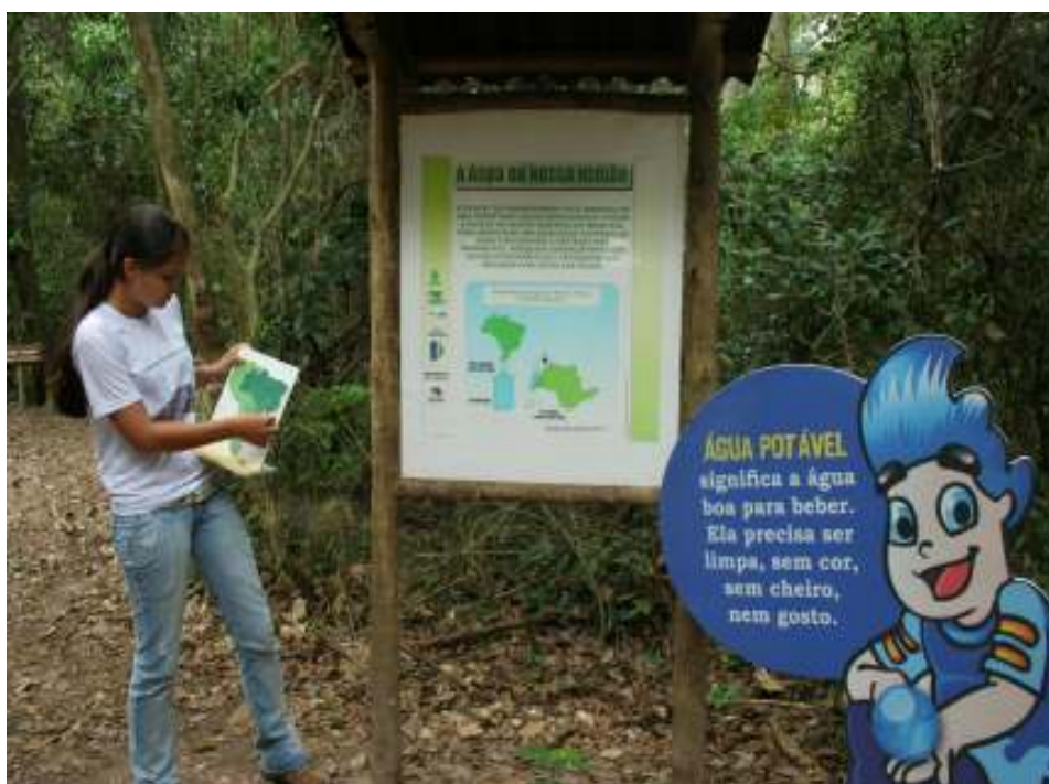
Fig. 6 – Materiais Utilizados para aplicação da Educação Ambiental.