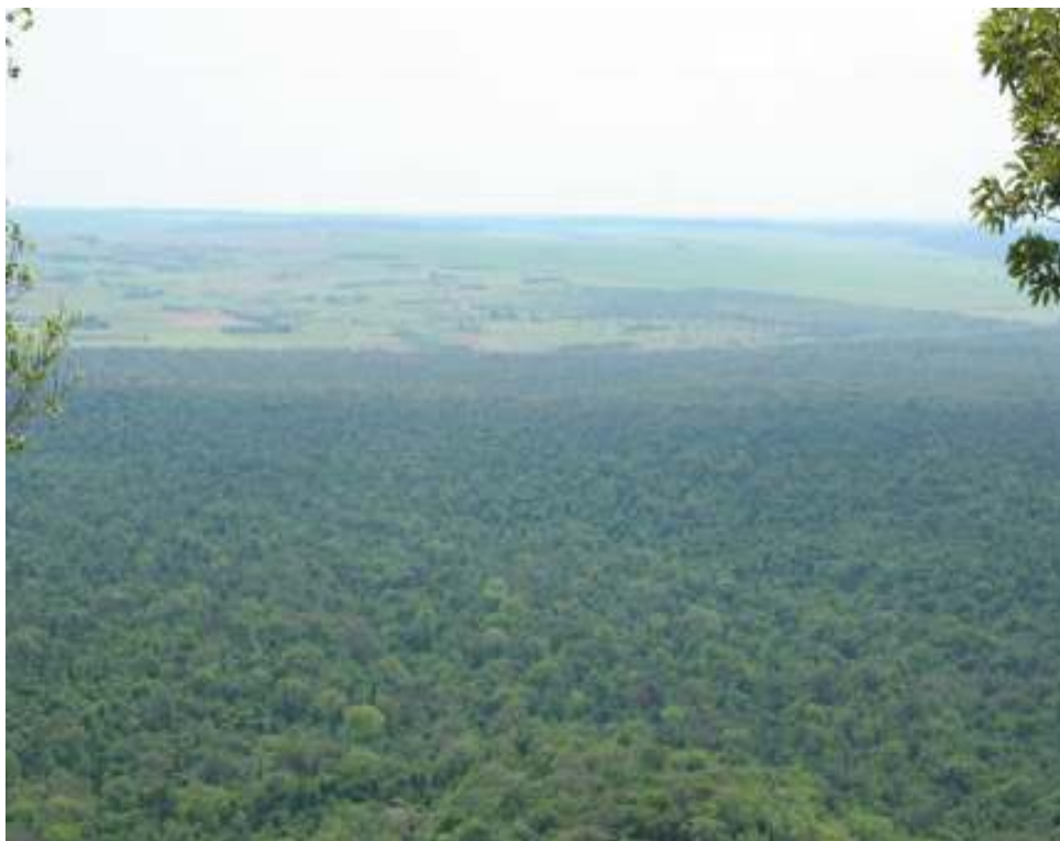
Fig. 4 – Ocupação do solo em áreas limítrofes ao Parque.

Trilha das Perobeiras, esta tem sua trajetória projetada para mostrar uma seqüência de enormes Perobas, porém, um grande atrativo é a presença de uma Figueira centenária, mas essa trajetória é assim concedida para trabalhar o tema do desmatamento, onde por meio do guia é trabalhada a questão da extração ilegal de madeiras e o comercio clandestino desse produto. Para fins da EA o guia faz uma campanha de conscientização contra o desmatamento e a importância da certificação de legalidade na comercialização de madeiras.